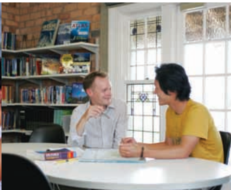
Los profesores ayudan a los alumnos a desarrollar programas de aprendizaje personalizados

www.languages.ac.nz/our_school/learning_centre.htm