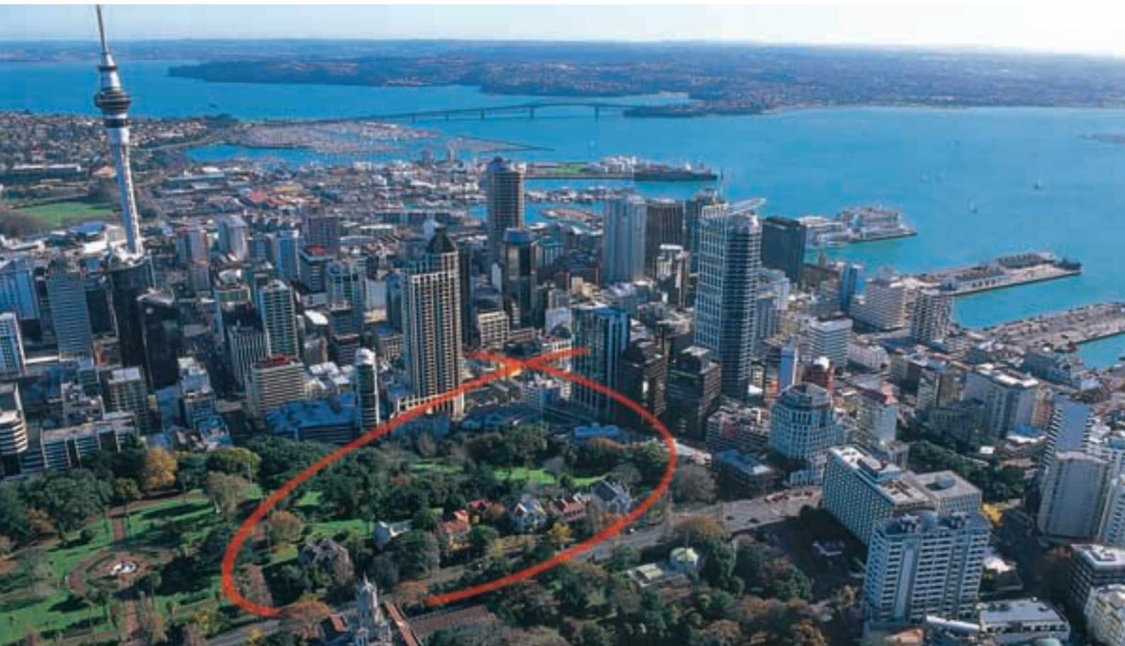
Instalaciones de Princes Street y Chancery