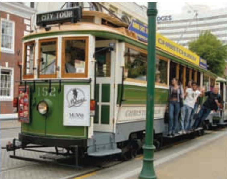
El histórico tranvía pasa delante de la escuela