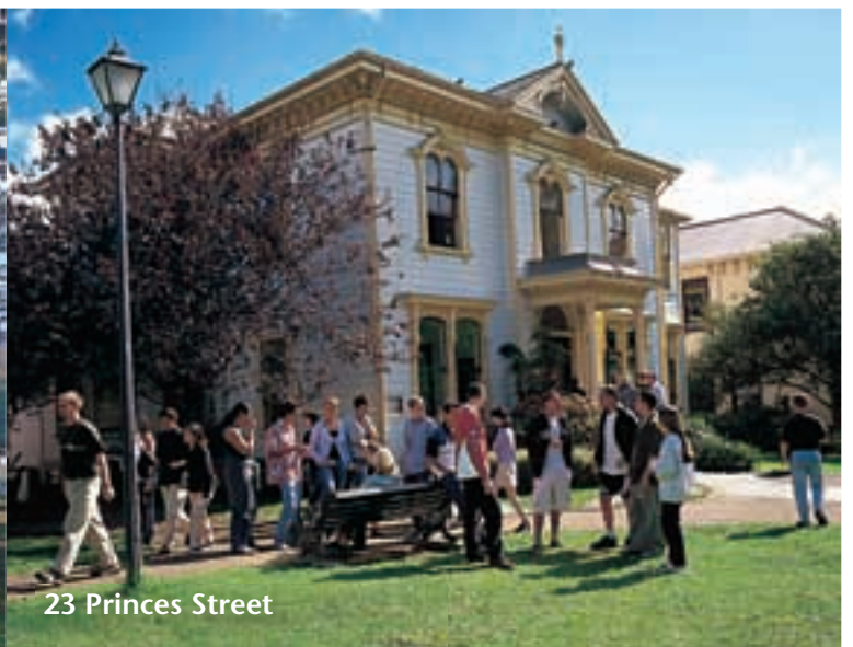
23 Princes Street