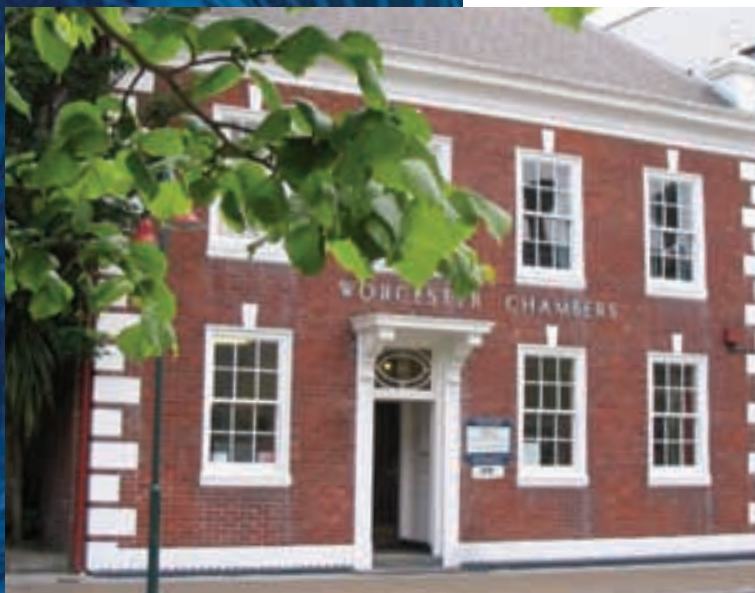
Languages International en Christchurch