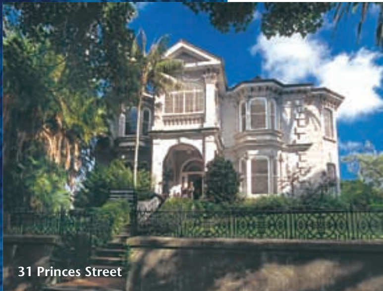
31 Princes Street