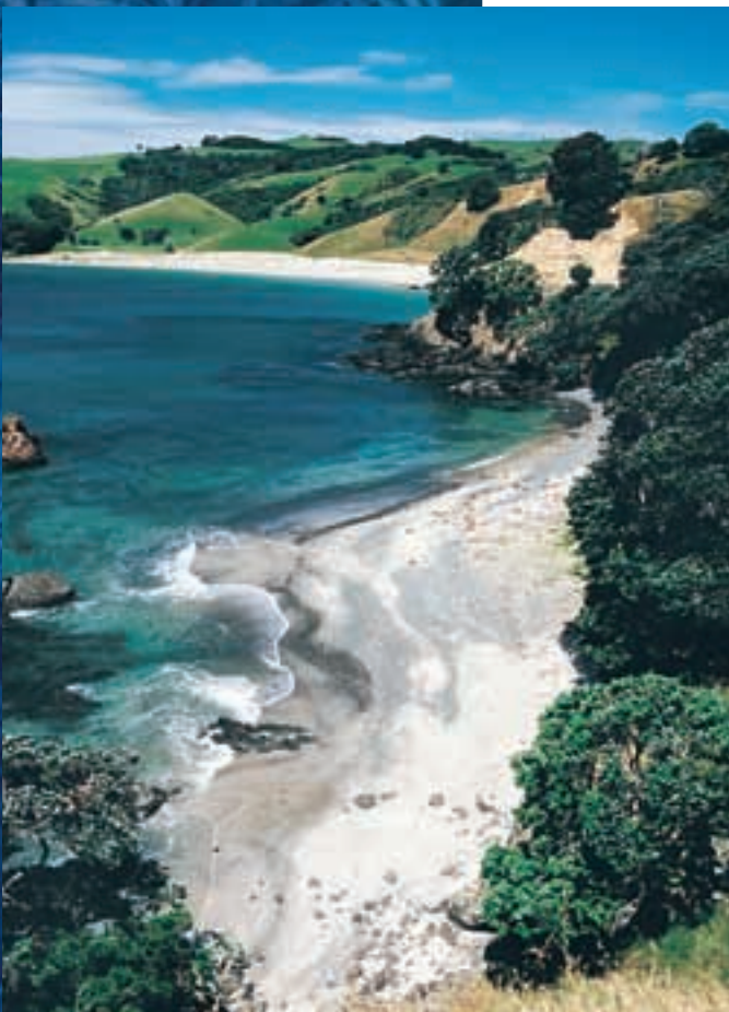
Isla Waiheke, a 30 minutos del centro de Auckland

Todos los cursos están acreditados por la Autoridad de Calificaciones de Nueva Zelanda (NZQA)