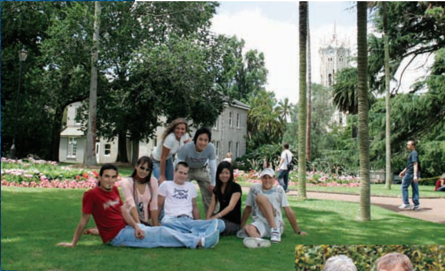
Alumnos detrás de Languages International Auckland, en Albert Park