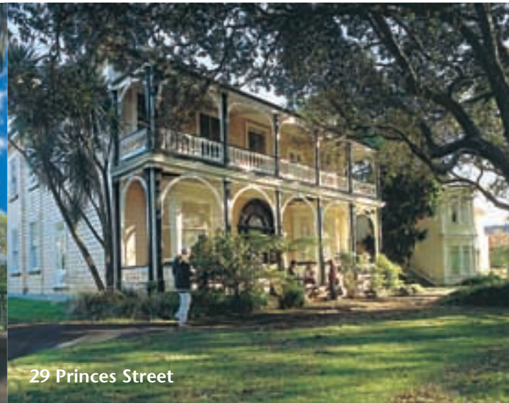
29 Princes Street