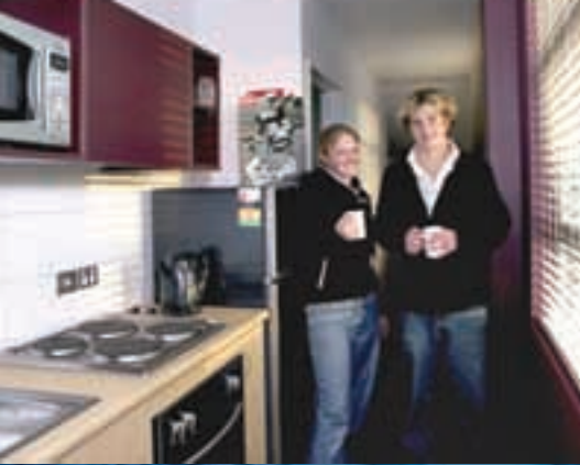
"Living Space" Residencia estudiantil en Christchurch

Si pasas tu estancia con una de nuestras familias de acogida, encontrarás un hogar acogedor que te ofrecerá cariño y seguridad. Ésta es la mejor forma de experimentar el estilo de vida neozelandés y de practicar el idioma que aprendes en la academia durante el día.