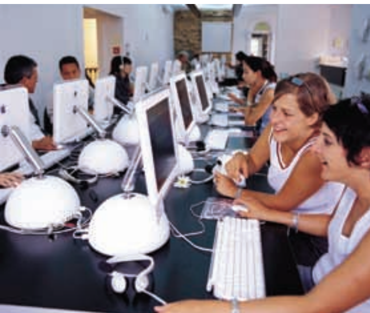
Centro de Enseñanza en Auckland