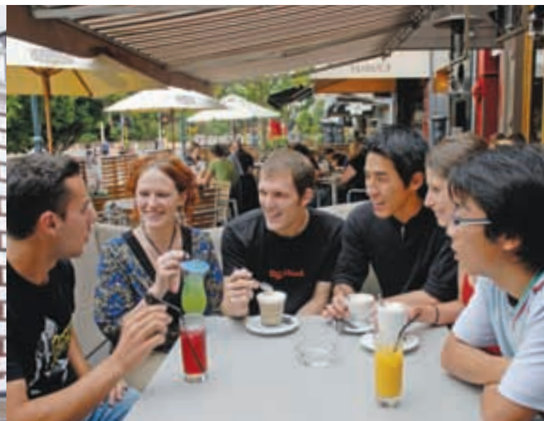
La academia está en el centro de la zona de cafés