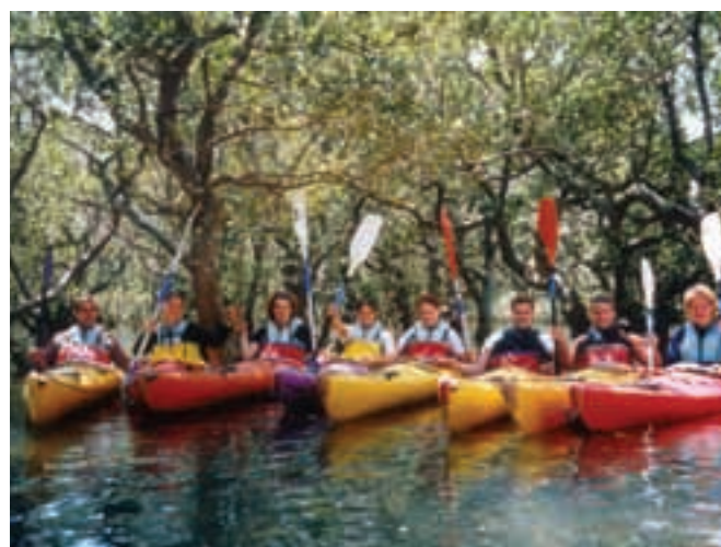
Los profesores participan en todas las actividades sociales de la academia

Los fines de semana puedes visitar una gran variedad de puntos de interés cerca de Auckland y Christchurch. Hay una variedad de excursiones tanto de un día como de dos. Con el fin de ofrecerte una gran variedad de excursiones, trabajamos en colaboración con agencias de viaje cuidadosamente seleccionadas. Estas excursiones las lideran guías turísticos con experiencia.