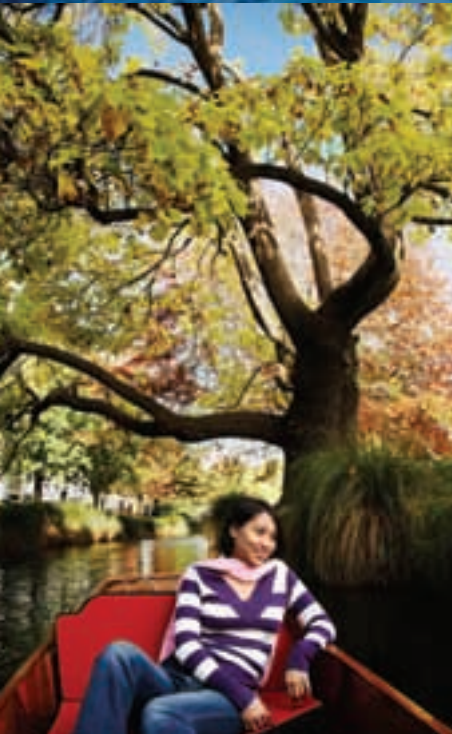
El río Avon está a un minuto a pie de la escuela