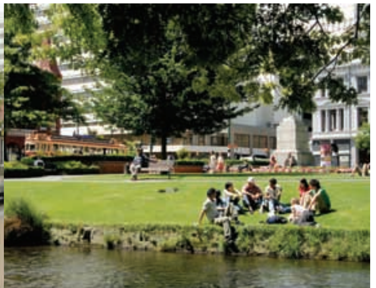
Almuerzo junto al río Avon cerca de la escuela