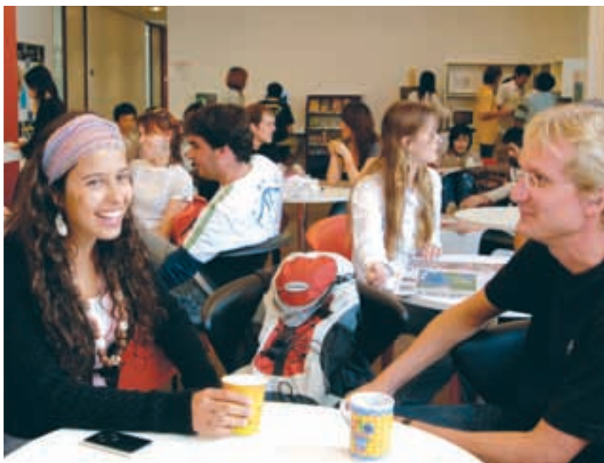
Cafetería de estudiantes en Christchurch