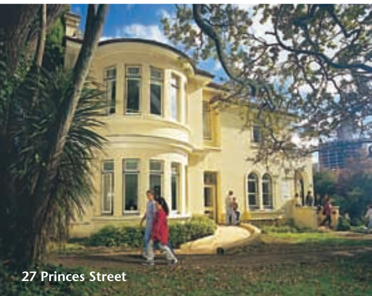
27 Princes Street