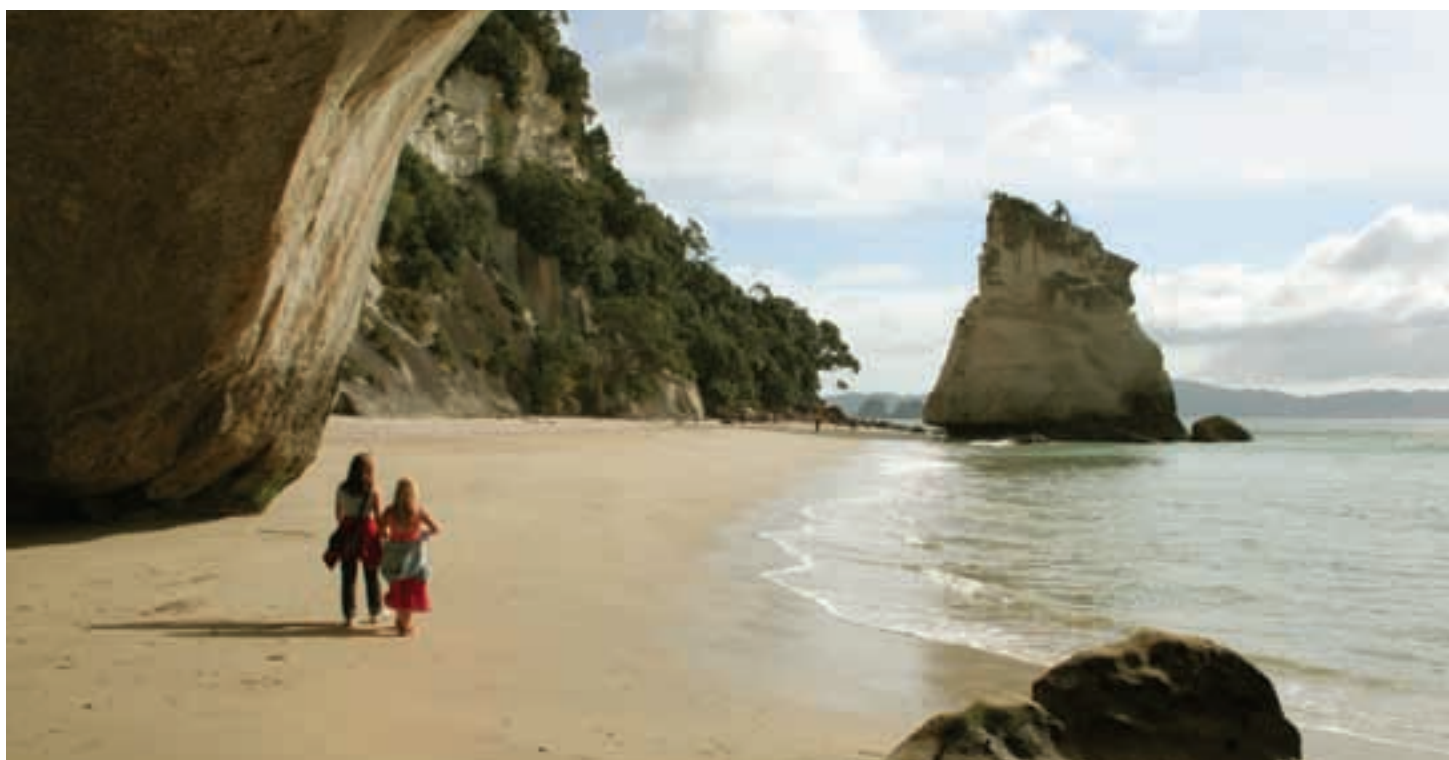
Coromandel, a 90 minutos al sur de Auckland